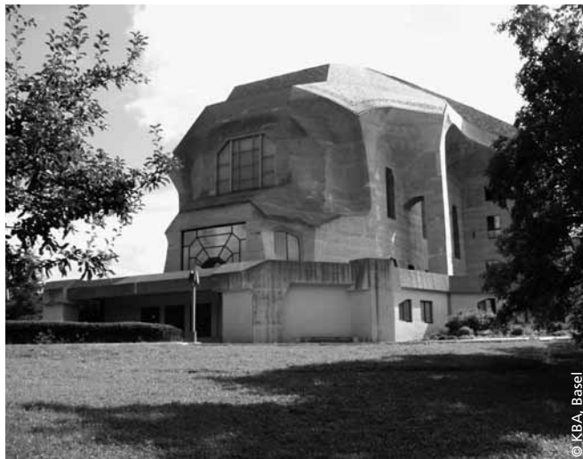
Warum und wozu liegt uns das Goetheanum am Herzen? Pourquoi et en quoi le Goetheanum me tient-il à cœur ?