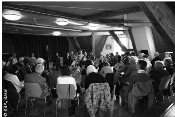
Der Delegierten-Kreis im Saal der Steinerschule Schaffhausen. Les délégués dans la salle de l'école Steiner de Schaffhouse.

La rencontre des délégués a été reçue par la branche Johannes von Müller dans les locaux de l'école Rudolf Steiner de Schaffhouse, le 24 avril dernier. Un samedi de printemps magnifique, un accueil chaleureux et convivial, une cinquantaine de participants venus des quatre coins de la Suisse : il n'en fallait pas moins pour aborder dans de bonnes conditions un thème difficile – la paix mondiale et l'action de Rudolf Steiner dans ce sens.