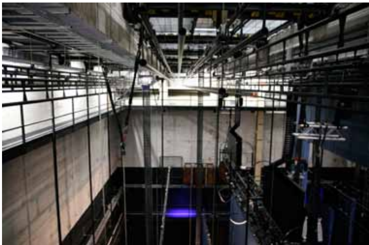
Blick in den Schnürboden des Bühnenraumes.