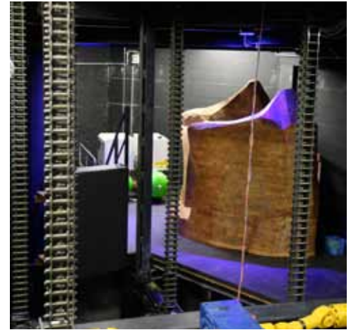
Das Rednerpult steht im Orchestergraben.