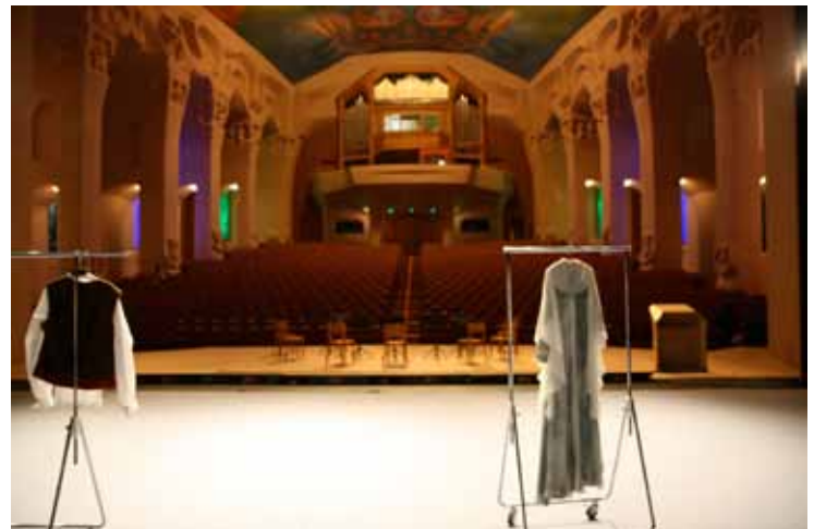
Blick von der Bühne in den Grossen Saal.