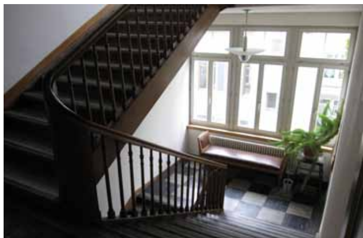
Das Treppenhaus und der 1. Stock im Alten Gerichtsgebäude in Pfäffikon ZH.