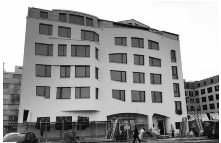
Die neue Freie Gemeinschaftsbank an der Meret-Oppenheim-Strasse 10 in Basel, gleich hinter dem Bahnhof.